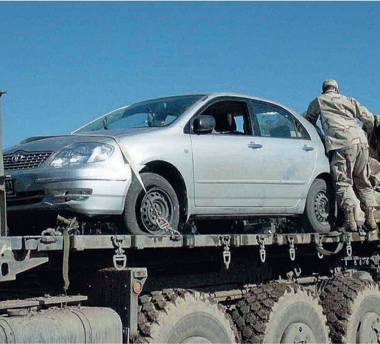
Tragedia La Toyota Corolla sulla quale viaggiava Calipari.

L'autore era direttore del Manifesto ai tempi del sequestro Sgrena